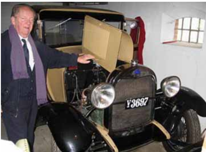
Den solgte Ford

til høj- og lavgear, én til bak og så bremsen. Og så var der for resten også håndgas og ingen speeder. Jeg kan bedst lide en rigtig gearstang.